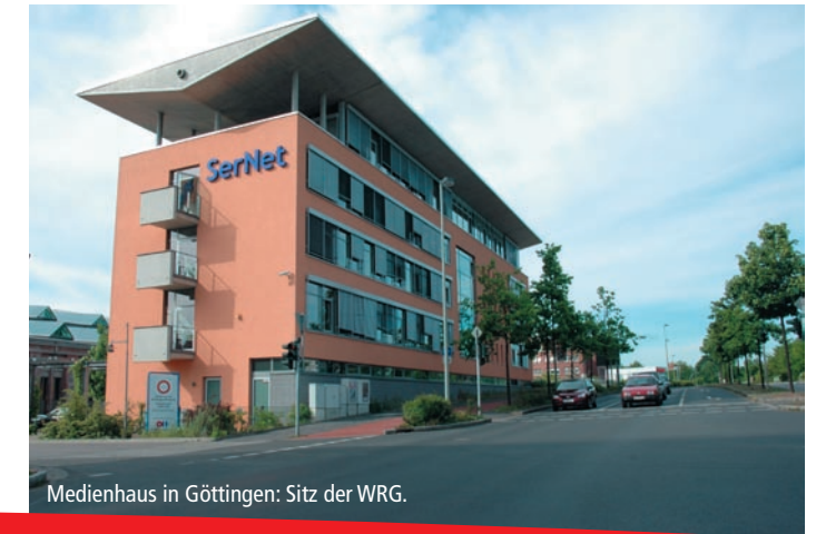
Medienhaus in Göttingen: Sitz der WRG.

Sollten Sie eine Investition für Ihr Unternehmen planen, dass zukunftssichernd ist und Arbeitsplätze schafft, sprechen Sie rechtzeitig mit uns und lassen Sie uns gemeinsam prüfen, ob eine Zuschussförderung in Betracht kommt. Weitere Kriterien für eine Zuschussförderung werden in der Richtlinie detailliert beschrieben. Die Richtlinie sowie die Unterlagen zur Antragstellung finden Sie im Downloadbereich unserer Website: www.wrg-goettingen.de